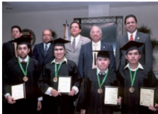
Alumnos de la FIME que fueron distinguidos con el Reconocimiento al Mérito Académico.