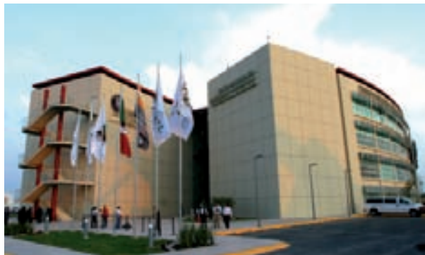
Centro de Innovación, Investigación y Desarrollo en Ingeniería y Tecnología de la UANL.

en la consolidación del proyecto de la Ciudad Internacional del Conocimiento y de la Universidad como un polo de desarrollo científico, tecnológico y humanístico del más alto nivel y de profundo impacto social.