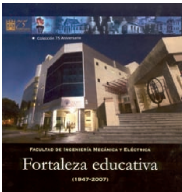
Portada del libro conmemorativo de los 60 años de la FIME.