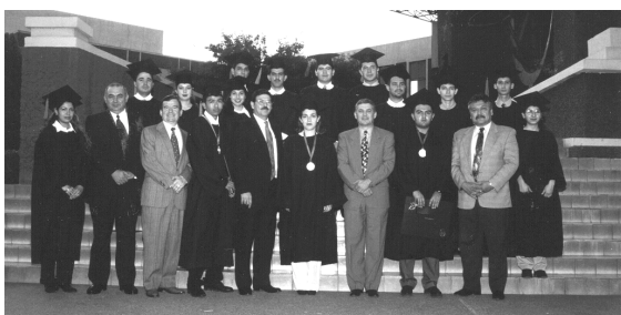
Alumnos acreedores a la Medalla al Mérito Académico y a Menciones Honoríficas en el período agosto 1998 a enero de 1999. Los acompañan autoridades de la UANL y FIME.